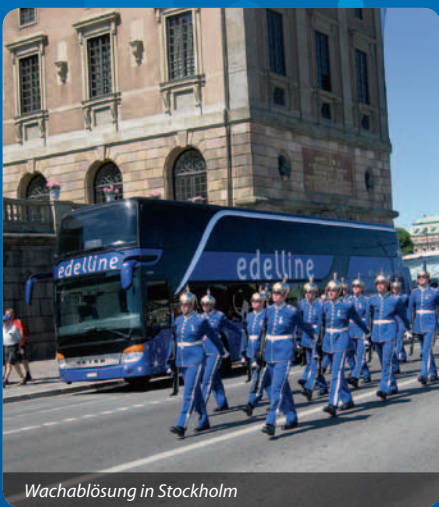
Wachablösung in Stockholm