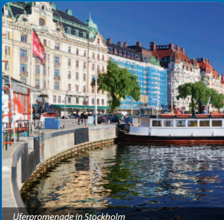
Uferpromenade in Stockholm

Heute erwartet uns eine Stadtrundfahrt durch das «Venedig des Nordens». Die Stadt, die sich stolz über die Ostsee erhebt, ist über 700 Jahre alt und auf 14 Inseln erbaut. Wir besichtigen Gamla Stan, die auf einer Insel gelegene Altstadt, sowie auch das Stadshuset, wo jedes Jahr die Nobelpreisverleihung stattfindet. Nach der Rundfahrt und einem individuellen Mittagessen starten wir zur Bootstour «Unter den Brücken», auf welcher wir Stockholm vom Wasser aus geniessen können. Die Fahrt bringt uns an 15 Brücken und zwei Schleusen vorbei und wir fahren sowohl auf dem Meer wie auch auf dem Mälarensee. Der Rest des Nachmittags ist anschliessend zur freien Verfügung.