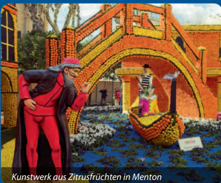
Kunstwerk aus Zitrusfrüchten in Menton

Nach einem letzten Frühstück im Hotel verlassen wir die Côte d'Azur mit vielen neuen Eindrücken und treffen am Abend in der Schweiz ein.